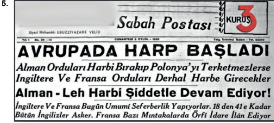
Görsel: Gazete manşeti