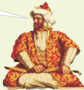
Osman Bey'i Gösteren Temsilî Resim

Yapılması gereken komşularımızla iyi geçinip dostluk kurmaktır. Fethettiğimiz yerleri mamur hale getirmektir.