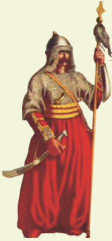
Gündüz Alp'i Gösteren Temsilî Resim

Osman Bey ile kardeşi Gündüz Alp arasında beyliğin genişletilmesi ile ilgili şöyle bir konuşma geçmektedir.