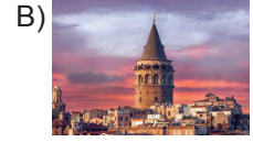
Galata Kulesi, İstanbul