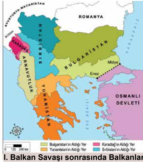
I. Balkan Savaşı sonrasında Balkanlar

Bu haritalara göre I. Balkan Savaşı'nın sonuçları ile ilgili aşağıdakilerden hangisi söylenemez?