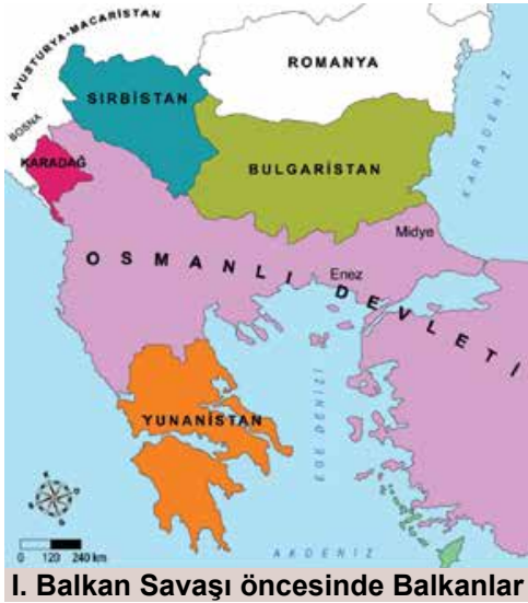
I. Balkan Savaşı öncesinde Balkanlar